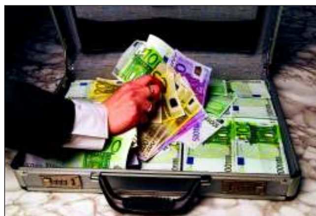
120.000 Euro in den Sand gesetzt