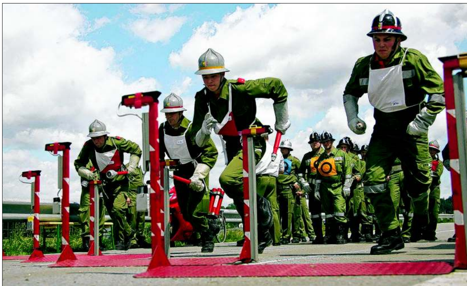
Mit 1550 Aktivgruppen und 1250 Jugendgruppen gibt es beim Leistungsbewerb in Freistadt einen neuen Teilnahmerecord.