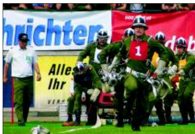
Ziel ist die Qualifikation für den Bundesbewerb.